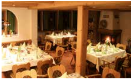
Kaminzimmer im Haus Kienberg an Tischen 30 Personen