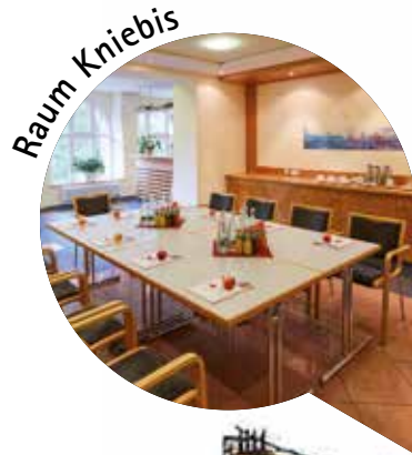
Raum Kniebis 41 m 2 bestuhlt 25 Personen U-Form 12 Personen