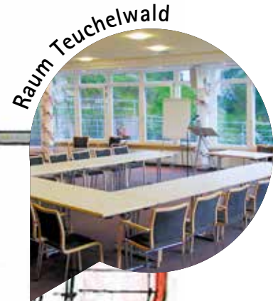
Raum Teuchelwald 110 m 2 bestuhlt 90 Personen an Tischen 65 Personen