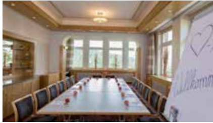
Raum Freudenstadt 45 m 2 bestuhlt 30 Personen an Tischen 20 Personen